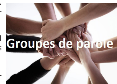
Groupes de parole